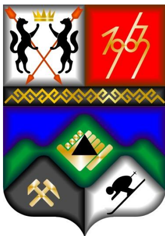
Схема теплоснабжения Мундыбашского городского поселения

Заказчик: Администрация Мундыбашского городского поселения