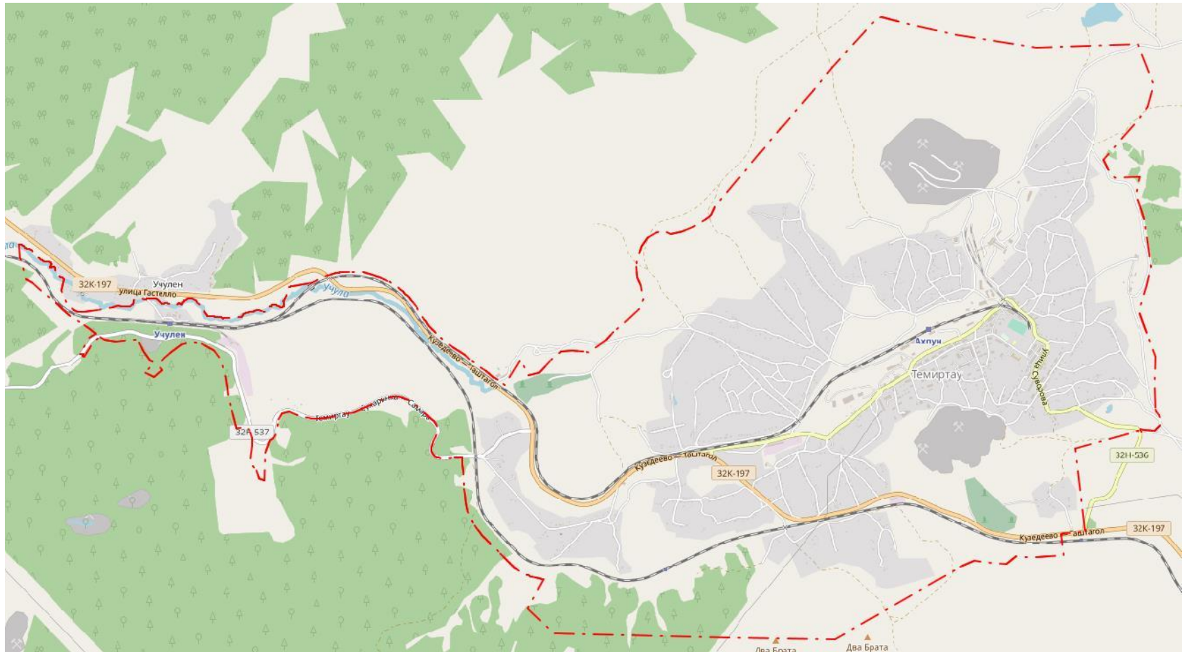
Рис. 1.1. Границы городского поселения